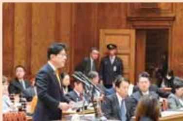
予算委員会集中審議で質問に立つ