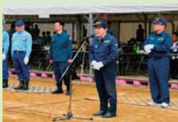
肱川総合水防演習に参加