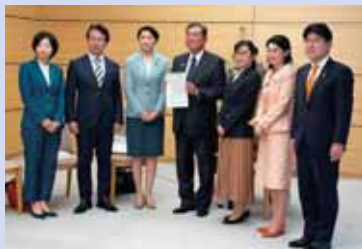
出産費用の無償化の実現を提言