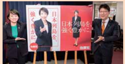
広報戦略局長として高市新総裁のポスターを発表