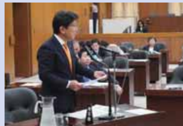
厚生労働委員会で医師の偏在是正を訴える