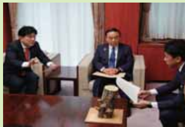
しいたけ生産者への支援強化を小泉大臣に要望