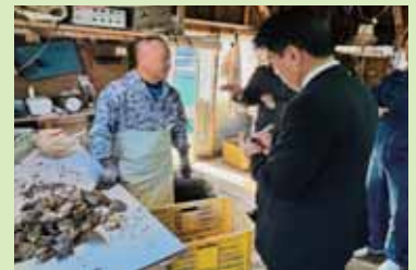
愛南町の力キ養殖のへい死状況を視察