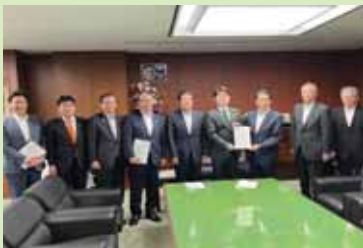
中村知事とともに高速道路の整備促進を要望