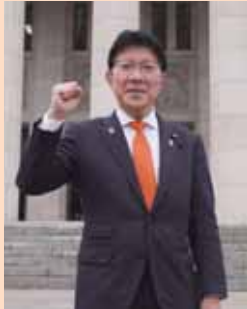
新たな決意で初登壇