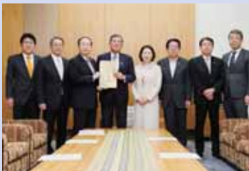
「シン・地方創生」を提言