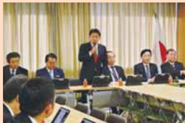
内閣第一副会長として挨拶